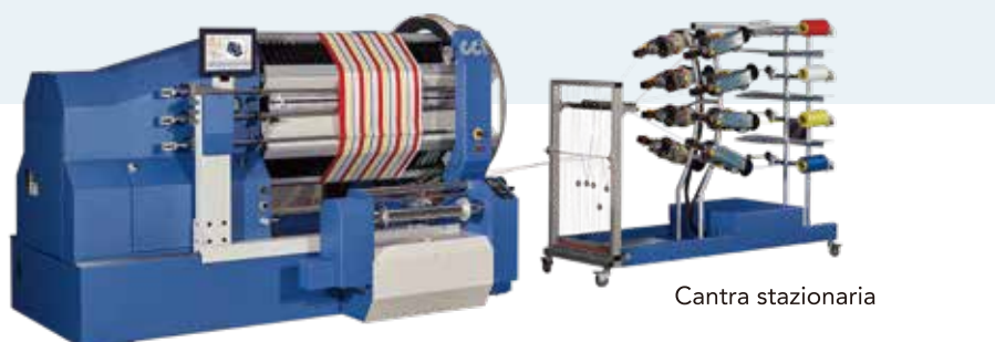
Mini Lutan 500

La serie Mini Lutan è lo strumento di orditura più economico, conveniente e completo per soddisfare la maggior parte delle vostre esigenze.