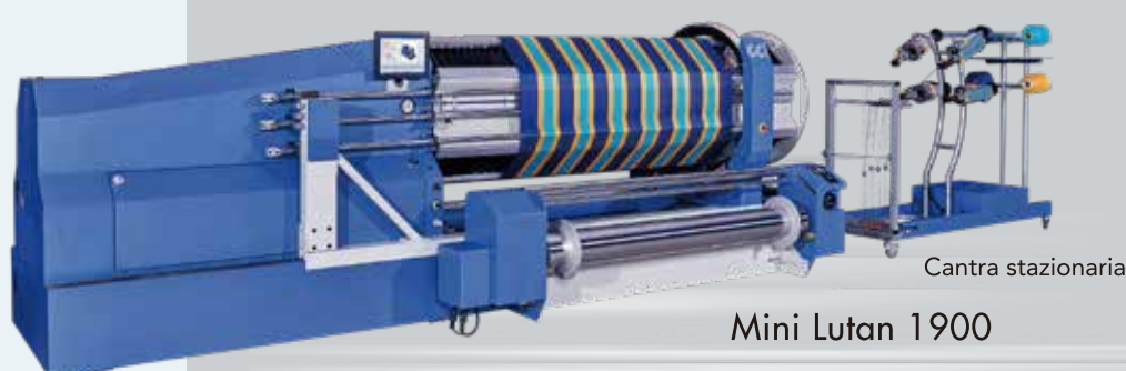
Mini Lutan 1900